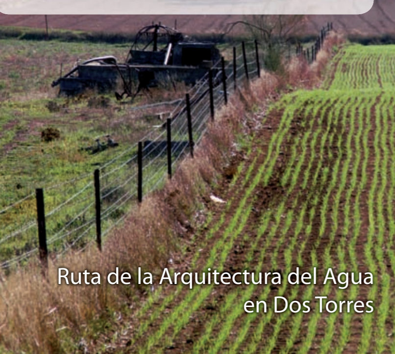
Ruta de la Arquitectura del Agua en Dos Torres

Más información: Ayuntamiento de Dos Torres Área de Cultura y Turismo: 957 134 001 www.dostorres.es E-mail: turismo@dostorres.es Oficina Municipal de Turismo de Dos Torres: 957 134 562 E-mail: oficinadeturismo@dostorres.es www.dipucordoba.es/medio_ambiente