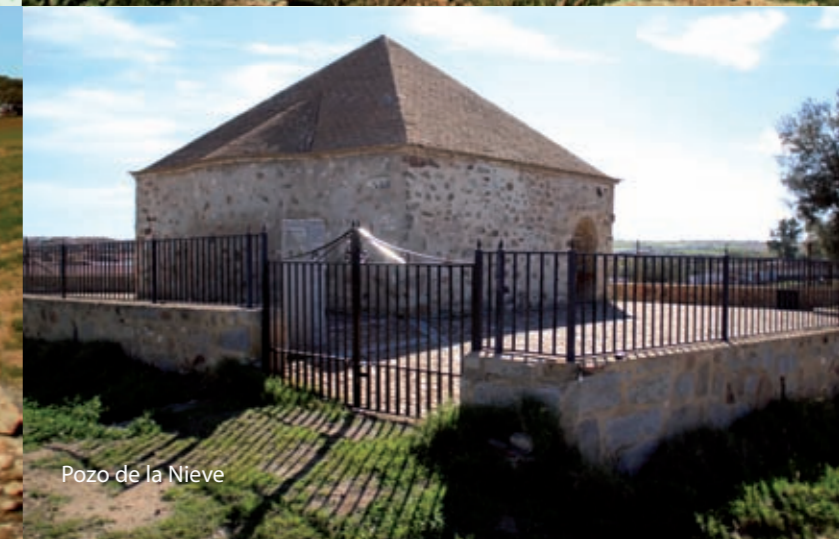
Pozo de la Nieve