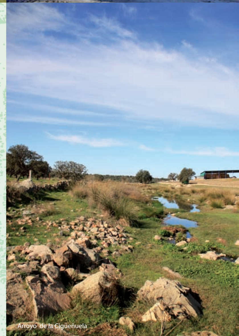
Arroyo de la Cigüeñuela

Nos introducimos en la dehesa por el camino de “San Alberto”, trayecto por el cual podremos disfrutar del paisaje arbolado, que se ve interrumpido por linderos de caminos llenos de flores, arbustos y arroyos. Aproximándonos al casco urbano de Dos Torres, comienzan a aparecer de nuevo las huertas, donde volveremos a encontrar algunos pozos y norias antes de llegar al cruce con el camino asfaltado de “El Rollo”. Seguimos este camino en dirección al casco urbano y en la zona conocida como El Calvario , giramos a la derecha para llegar hasta la ermita de San Sebastián y al Pozo de la Nieve (antigua basílica paleocristiana), con la última noria de la ruta al frente.