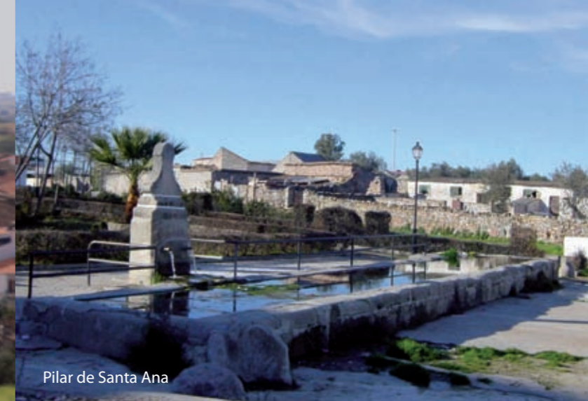
Pilar de Santa Ana

Dos Torres cuenta con un notable catálogo de elementos del patrimonio hidráulico (fuentes, norias y abrevaderos), así como espacios de gran valor ambiental. La Ruta de la Arquitectura del Agua comienza en el camino conocido como “Callejón de las Vacas” hasta el “camino de Dos Torres a Santa Eufemia”. Tras recorrer algunos metros de esta vía tomamos el “camino Valdelafuente”, donde podremos observar los restos de muchas de las norias que extraían agua en las huertas próximas a los arroyos Milano y de la Cigüeñuela .